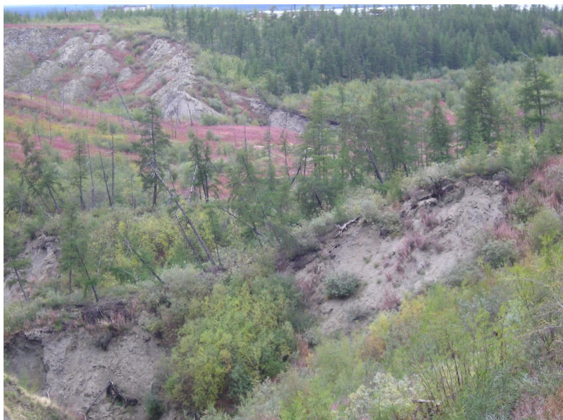
„Opilý les“