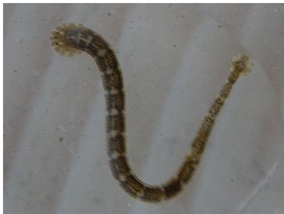
Chobotnatka rybí

skvrny, to je ta přední. Druhá je větší, mající tvar talířku. Celkově je chobotnatka rybí velká až 5 cm. V minulosti byla cizopasníkem, který byl velmi hojný v chovných rybnících, sádkách a ušetřeny nebyly ani ryby řek. V současné době, když nakukuji do vánočních kádí, zdá se mně, že její počet klesá. Je možné, že jde o dojem čistě subjektivní, ale sledováním naší drobné zvířeny v rybnících nabývám dojmu, že současné intenzivní rybniční hospodaření nevyhovuje ani těmto tvorům. Třeba se časem k problému pijavek vrátím právě z tohoto pohledu. -vh-