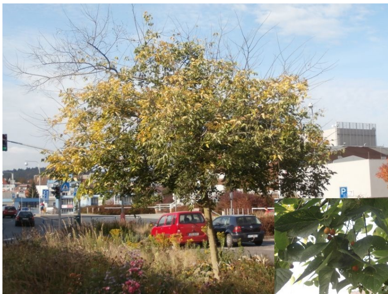
Břestovec západní

Tento strom patří stejně jako jilmy (viz článek pana Ing. Viléma Hrdličky v Kompostu č. 8/2012 ) do čeledi jilmovité ( Ulmaceae ). Listy břestovce západního jsou stejně jako u jilmu nesouměrné, na bázi slabě srdčité, 6 – 12 cm dlouhé. Květy jsou drobné a barevně nenápadné, žlutozelené. Zajímavé jsou plody – kulovité peckovice, za zralosti hnědooranžové, asi 1 cm velké. Právě kvůli plodům jsem si tento strom několikrát spletla s třešní. Břestovec západní však má plody spíše dekorativní, než konzumovatelné, s tenkou suchou dužninou, na rozdíl od břestovce jižního ( Celtis australis ), a anglického názvu pro břestovec Sugarberry . Břestovec západní pochází ze Severní Ameriky. Dřevo břestovců je husté a těžké, pružné, ohebné a houževnaté. Dělal se z něho kolářské výrobky, foukací hudební nástroje, vesla, hole i rybářské pruty, „triesky“, podle centra obchodu s břestovcovým dřevem, Terstu. Strom výborně snáší hubené půdy, sucho, úpal i zastínění, je odolný vůči exhalátům. Ve Strakonických jsem našla břestovec západní na parkovišti u kina OKO.