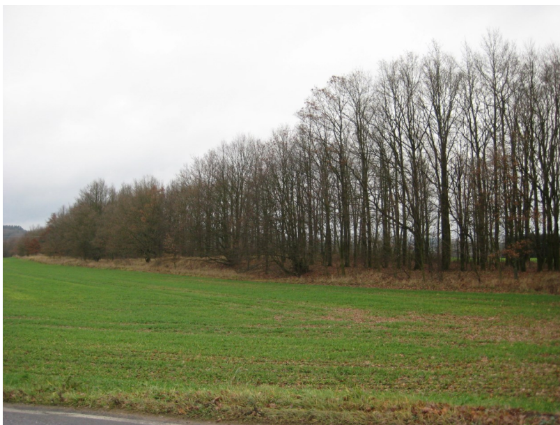
OLP II u Hubenova, foto Miroslav Treybal

Práce byly zahájeny na podzim roku 1951. Větrolamy byly založeny v patnácti katastrálních územích severozápadně od města Strakonice. Celková délka pěti pásů, označených čísly I – V, je 22 km s plochou cca 50 ha. Úspěšné provedení takto rozsáhlé akce nebylo snadné. Potíže nenastaly ani tak s vlastní prací, jako spíše s následnou ochranou provedené výsadby. Zemědělci, tehdy většinou ještě soukromí, byli zásadně proti zakládání pásů na jejich pozemcích, a proto je nešetřili, ale mnohdy i úmyslně ničili, pásli v nich dobytek, používali je jako cesty ke svým polím apod. Vyžadovalo to neustálé hlídání, jednání s místními národními výbory, které ale ani samy neměly zájem se v těchto věcech příliš angažovat. Řadu let bylo proto nutné se o výsadby starat, vylepšovat poškozené úseky, ožínáním a okopáváním chránit sazenice proti buření. Pracovníků sil