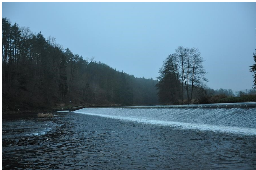
Jez u Střelských Hoštic