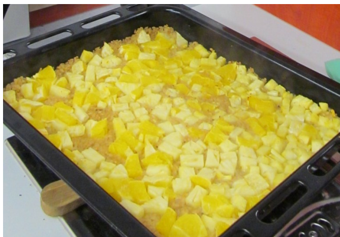
Rýžový náky

vin. Konzervováním ovoce jej spíše uchováme k nejrůznějším kulinářským úpravám. Přidávaný cukr a tepelná úprava snižuje dietetickou hodnotu takové potraviny.