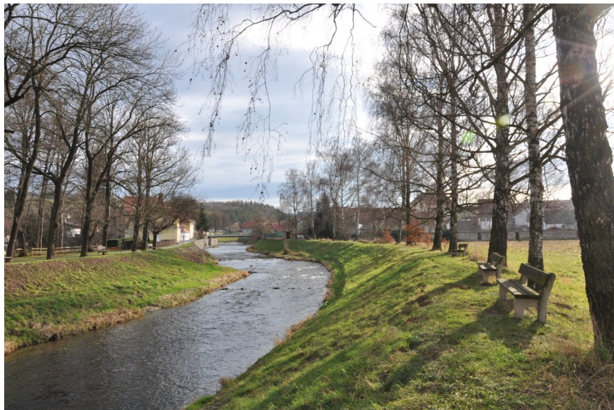
Část dotčeného porostu v lokalitě Na Zvěřinci

pomoci analyzovat, které konkrétní úseky řeky jsou při rozlivech nejproblematictější, jakým způsobem se voda mimo koryto chová a na jaká další opatření krom výstavby povodňových hrází je třeba se soustředit. Další slabinu projektu spatřujeme v projektování hrází pouze do stávajících břehů řeky bez možnosti kontrolovaných rozlivů nad městem a částečně i v něm. Tento postup by měl za následek akceleraci povodňových vln a zhoršování situace pro sídla ležící níže po toku. Pokud by došlo k případnému kácení dřevin, je plánována na několika lokalitách ve Volyni náhradní výsadba v počtu 92 stromů – tedy v poměru ke káceným stromům přibližně 1:1. Tento poměr považujeme z důvodu mohutnosti a velkého ekologického významu kácených stromů za jednoznačně nedostačující. Projekt budeme nadále intenzivně sledovat. Naším cílem je nalézt takový kompromis, který by neznamenal prosazení jednoho veřejného zájmu na úkor veřejného zájmu jiného. -jj-