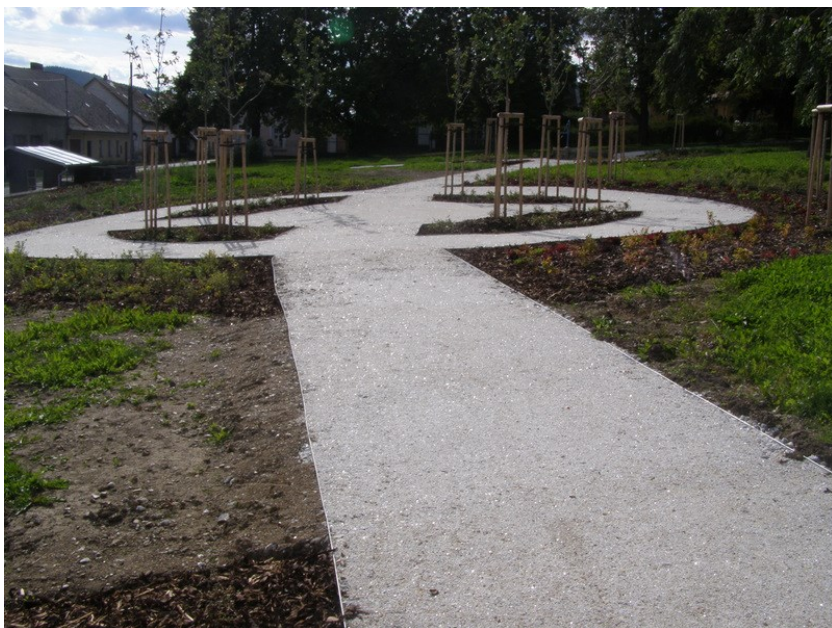
Obnova mlatových cest v parčíku na návsi v Horách Matky Boží

Ochrana kořenů: V případě provádění výkopových prací v obdobích mrazů a v termínu od 1. 11. do 31. 3. je nutno kořeny chránit před promrznutím např. silnou vrstvou geotextilie. Nejvhodnější termín pro provádění výkopových prací vzhledem k vegetačním nárokům dřevin je po opadu listů do příchodu mrazů větších než -5\text{ }^{\circ}\text{C} a na jaře po skončení mrazového období max. do poloviny dubna. Ochranu odkrytých kořenů bude také třeba provést v době, kdy zůstane výkop dlouhodobě odkrytý – chránit kořeny před vysycháním např. navlhčenou geotextilií. Ing. Lenka Vamberová