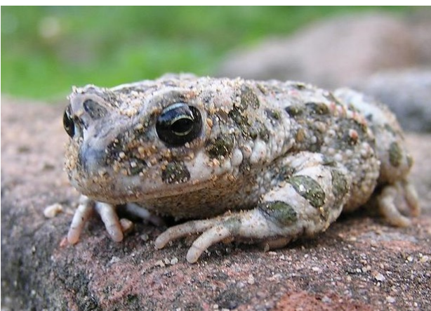
Ropucha zelená

Pro některé z nás nastává čas podzimních prací. Často spočívají v rycí či kutací činnosti, kdy velebíme naše zahradní zeminy, drtíme hroudy, sbíráme plody naší půlroční práce. I přes zdánlivý stav klidu v půdě a očekávání zeleniny se můžeme kromě hmyzích larev setkat s nenadále větším živočichem. To mně připomněl nález přejeté ropuchy zelené ( Bufo viridis )