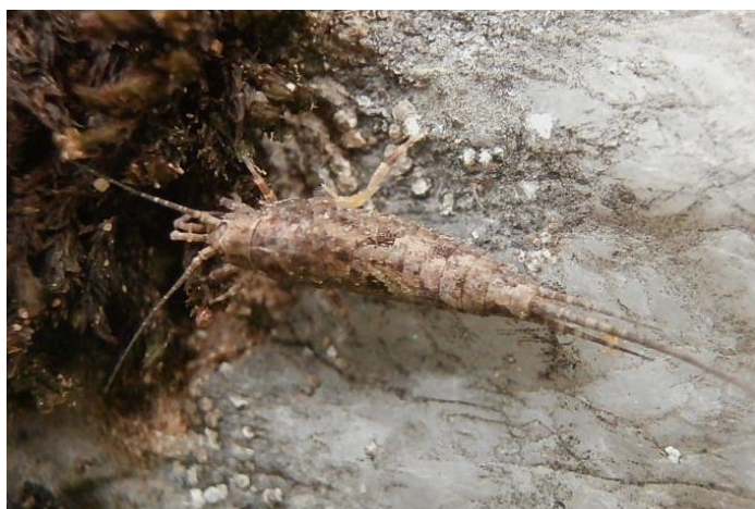
Chvostnatka z čeledi Machilidae