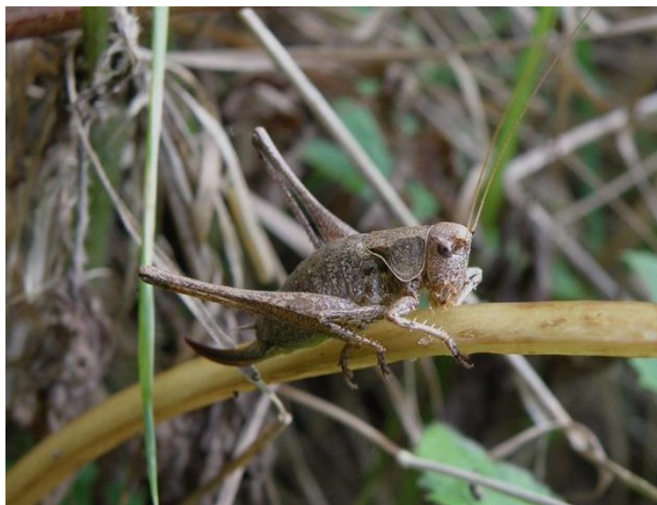
Katovice - křoviny za obcí - kobylička křovištní, foto -vh-

Cesta ke Střele po vstoupení mezi stromy je zprvu průchodná, ale brzo pěšina zmizí a po častých povodních je břeh Otavy schůdný jen brzy na jaře nebo v zimě. V období vegetace je nutno jít při kraji pole nebo se odvážit přechodu přes louku v soukromém vlastnictví. Bohužel i ta nás zavede na silnici ke Střelskému rybníku. Odtud je cesta do Strakonice možná buď ke Starému Dražejovu, nebo mezi poli do Virtovy Vsi. Západně, nedaleko od Střelského rybníku se nalézá jedno ze známých