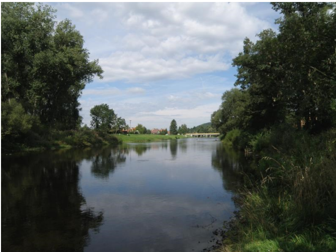
Katovice - řeka Otava

Maličký úsek naší krajiny strakonické prezentovaný krátkou cestou z Katovic ke Střele se může zdát nezáživný. Ale jen nevídmavý člověk by mohl přejít kapličku sv. Jana Nepomuckého na začátku nenápadné cesty stojící u mostu postaveného přes