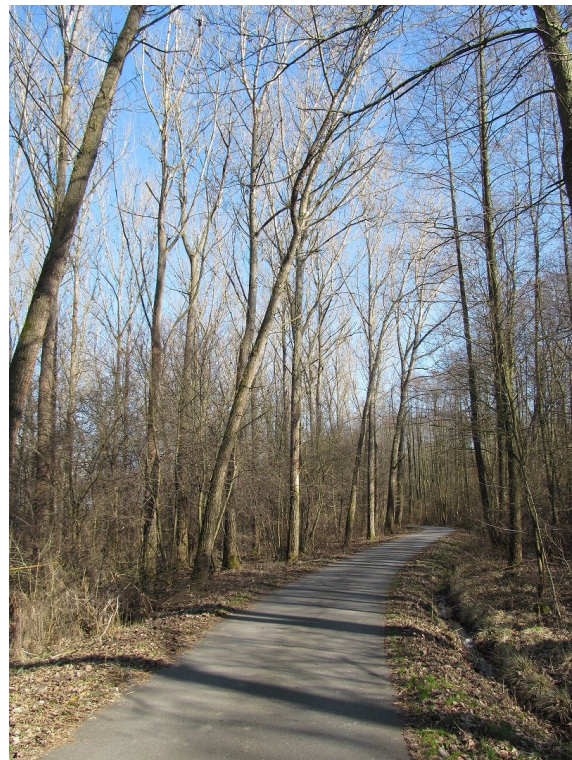
Část porostu topolu kanadského u cyklostezky Hajska - Čejetice, foto -jj-

Pozn.: článek je pouze shrnutím informací o této činnosti, k tématu se ještě určitě vrátíme podrobněji. -jj-