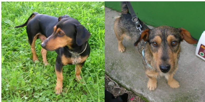
Brok a Čenda, foto Ivana Bůbalová

Do kotců umístěn 3. 9. 2014. Typický zástupce plemene jezevčík. Umí být tvrdohlavý, nevhodný pro pejskaře začátečníky. Miluje lidi a společnost. Po seznámení s ostatními pejsky je velmi kamarádský. Není zvyklý na děti a jiná domácí zvířata. Vhodné bydlení by pro Broka bylo v zateplené boudě na zahradě, v bytě sám štěká. Je očkovaný a odčervěný.