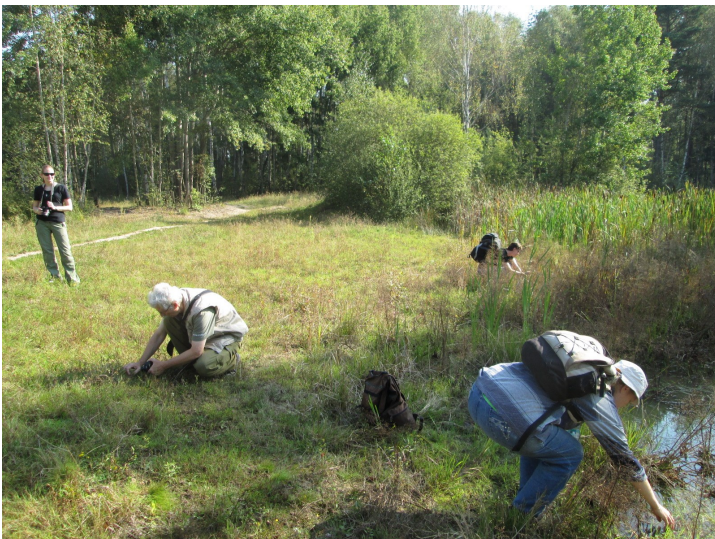
Přírodovědné bádání na lokalitě Na Plachtě

Představte si velice cennou přírodní lokalitu, která se jmenuje Na Plachtě, nachází se v těsné blízkosti jednoho ze sídlišť na okraji Hradce Králové, několikrát jí za poslední dobu hrozilo zastavení dalšími paneláky a v současné době je o ni pečováno poněkud netradičním způsobem – tu a tam je například zaangažována těžká vojenská technika a přes údiv a nepochopení věci neznalých návštěvníků tohoto pozoruhodného území se zde skutečně daří zachovat velkou druhovou pestrost, v dnešní době až nevídanou.