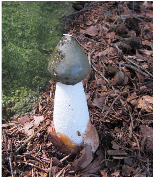
Hadovka smrdutá z Píseckých hor, foto -jj-

Aromatický sliz klobouku láká na hadovku velké množství nejrůznějšího hmyzu, zejména much. Ten pomáhá společně s deštěm šířit do okolí spóry obsažené ve slizu. Dospělá houba je nejedlá, ke konzumaci se však doporučují mladé doposud nezapáchající plodnice, ukryté v obalu. S vlastními kulinářskými zkušenostmi se nemohu podělit, nepodařilo se mi zatím houbu v tomto stadiu v lese objevit. -jj-