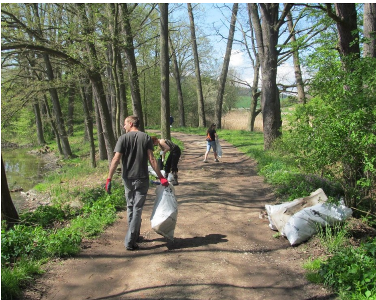
„Uklidme svět“ na Řepických rybnících

Blíž přírodě – nechceme před lidmi přírodu uzavírat, chceme lidem přírodu ukázat. Proto ve spolupráci se společností NET4GAS zpřístupňujeme formou naučných stezek, pozorovatelů, povalových chodníků či další turistické infrastruktury přírodovědně zajímavé lokality. Zanedlouho budeme otevírat již 65. lokalitu ( www.blizpriode.cz ).