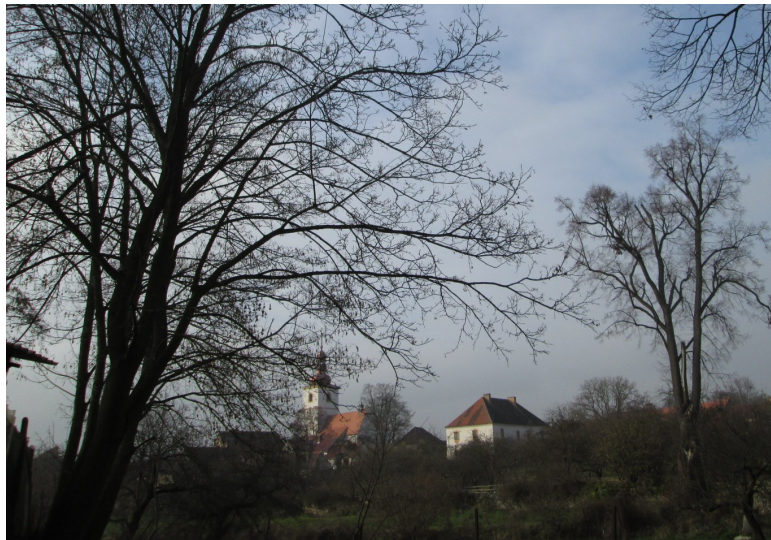
Kostel sv. Martina v Radomyšli

Pokračovali jsme okolo božích muk u Domanic a přes ně, okolo pařezů mohutných javorů klenů dále k Hornímu Řepickému rybníku. Při jeho březích jsme mohli vidět v postupujícím šeru zástupce šoupálek a poslouchat švitoření čížků lesních. Nedaleká vápencová skalka nám ukázala lezoucí suchomilku obecnou. Nutno však poznamenat, že její populace na této skalce se tenčí. A potom dále přes jalový splav Horního Řepického rybníku. Zde jsme se krátce zastavili u zapomenuté studánky v mezi. Bohužel byla zanesená listím, a tak se možná stane cílem některé naší návštěvy za účelem jejího vyčištění. Nedaleko Pravdova mlýnu jsme zaslechli ledňáčka říčního, který je zde již po několik let. A to nás již obstoupila tma, takže ještě okolo bývalého ptačího útulku při cestě do Droužetic, potom cestu mezi remízky na silnici od Droužetic do Strakonice. A to už jsme se ale vraceli do Strakonice za tmy. Ještě jsme ve skrytu duše doufali, že uvidíme nějakou sovičku, ale bohužel nic. Jedině nasvětlená krajina s lucernami veřejného osvětlení rušila kolorit řepických kopců, mezi nimiž se dala tušit věž kostela sv. Jiljí v Řepici. Poslední kroky tmou vedly blízko strakonických moruší na kraji Radomyšlské silnice, a tak jsme vkročili do města. -vh-