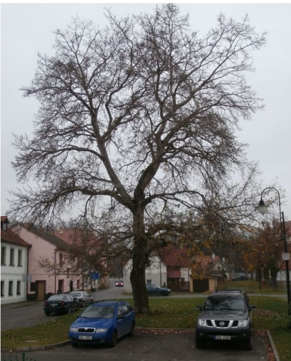
Topol bílý

HEJNÝ, Slavomil, SLAVÍK, Bohumil (editoři): Květena ČR 2. díl, Academia, Praha, 1990