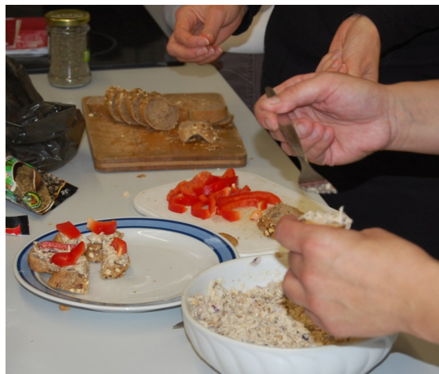
Zahajovací kurz zdravého vaření

Co všechno přinesla? Celkem 14 termínů, kolísavou návštěvnost, řadu spokojených prodejců i nakupujících a samozřejmě i část těch, kteří nadšení nesdíleli. Za tři roky si trhy stačily vytvořit okruh zájemců, a i když se zdálo, že účast na některých (zejména letních) trzích byla slabší, většina prodejců z nich odjížděla spokojená. To by znamenalo, že na trhy se již Strakoňáci naučili chodit za účelem cíleného nákupu, což bylo jedním z našich přání. Po celou sezónu jsme se snažili veřejnost informovat hlavně o přidané hodnotě trhu – tzn. šířit údaje o samotných prodejcích a jejich zboží. Jedním z oblíbených argumentů, proč si svůj nákup odbyt raději v supermarketu, je ten, že farmářské zboží je jeden velký podvod a vypočítavost pořadatelů farmářských trhů i prodejců. Ostatní trhy v regionu hodnotit nebudu, ale na těch strakonických je zachování jejich farmářského charakteru prioritou. Důkazem může být fakt, že nikdo z pořadajících subjektů nemá na trzích komerční zájem. Vznikly spontánně z činnosti Ekoporadny a tak celé tři sezóny fungují. V jaké podobě a jestli budou příští rok probíhat, není ještě stoprocentně jasné, ale velmi pravděpodobně se dočkáte jejich pokračování. Kolik prodejců se na nich bude objevovat, závisí do velké míry na návštěvnosti.