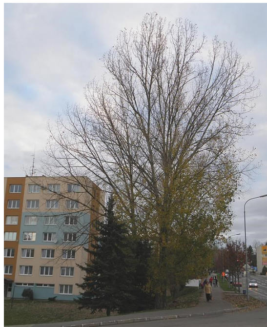
Topol kanadský v Ellerově ul. ve Strakonících