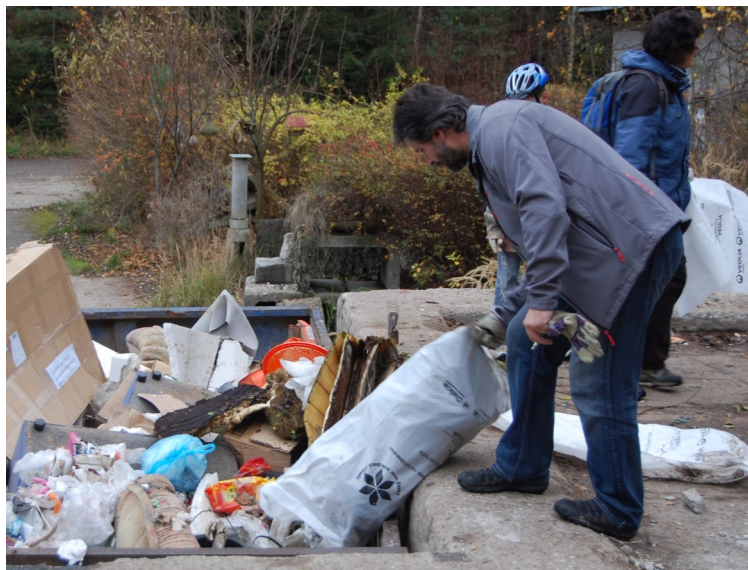
„Uklidme svět“ v pískovně V Holi, foto -jj-

I cyklus besed Zelené otazníky čekalo pro novou sezónu stěhování. Vyjednali jsme pro ně příjemné prostředí restaurace Baobab. Vyzozorovali jsme však návštěvnost těchto akcí silně závislou na jejich tématu. Vzhledem k mnohdy specifickým ekologickým oblastem, které jsou probírány, Zelené otazníky této sezóny na svou velkou návštěvnost teprve čekají. Ani bezplatné nezávislé energetické poradenství odborníků z Energy Centre ČB, ani možnost za zvýhodněnou cenu zakoupit a na