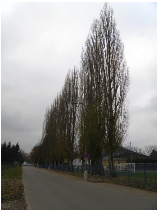
Topol černý u fotbalového hřiště ve Strakonici

„Okolo Strakonice roste osika“ platí - je u nás hojná. Já se na ni rád dívám, když jdu směrem od plaveckého stadionu k psímu útulku nebo od hřbitova u kostela sv. Václava ke Staré řece. Zde naleznete jedny z nejkrásnějších osik v našem okolí. Jinak ji najdete také u pískovny V Holi nebo nedaleko pískovny vlakového nádraží.