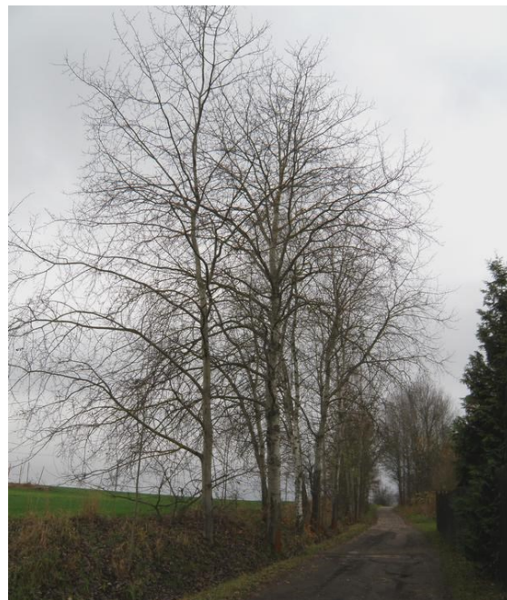
Topol osika při cestě od hřbitova sv. Václava ke Staré řece ve Strakonici