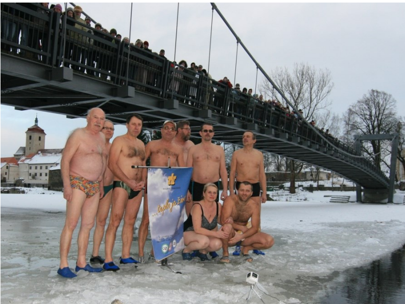
Otužilci Strakonice při každoročním novoročním plavání u hradu