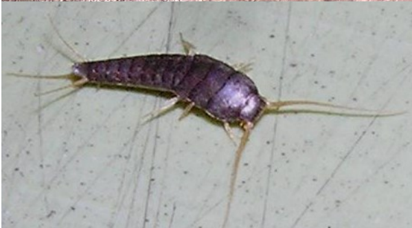
2x rybenka obecná z domácího chovu

ruce studentů zvedly v očekávání kýženého bodu, pan profesor prohlásil: „A vy všichni, kdož jste zvedli ruce, žijete nočním životem“. A skutečně tomu tak mnohdy bylo. Ale zpět k rybence. Tento nepatrný tvor nám žije ve výše zmiňovaných úkrytech a v noci si chodí na pomyslný mls v podobě drobného, pro nás nepotřebného smetí. Tím může být i část našich těl, která z nás opadá. Někde jsem četl, že z člověka za den spadne okolo 2g kožních destiček a jiného „materiálu“. Tak kdo by to uklízel? Jsou to třeba naše rybenky. Protože jsem za mládí rád čítával „starého“ Brehma a myslím, že zrovna v těchto časech se z přírodovědných publikací povětšinou vytratila drobná краса, dovolím si odcitovat, co napsal tento věhlasný přírodovědec o rybence: „ Jenom náhodou při otevření starých skříní a zásuvek nebo při odtržení staré tapety či podobných příležitostech uvidíme tyto něžné bělavé šupináčky, kteří při této neočekávané události prchají co nejrychleji. Za nočního temna odvažují se ze svých skrýší a mlsají a ohlodávají všude, kde se jim jen naskytne nějaká příležitost. Přitom rády vykonávají svoje ostatně naprosto bezvýznamné návštěvy zásobárnám ve spíži “.